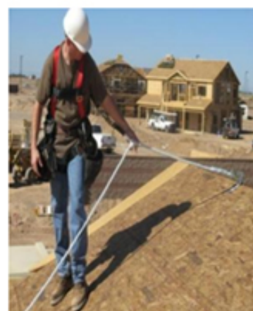
Sistema personal de detención de caídas