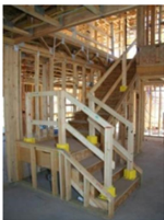
Barandillas de Seguridad